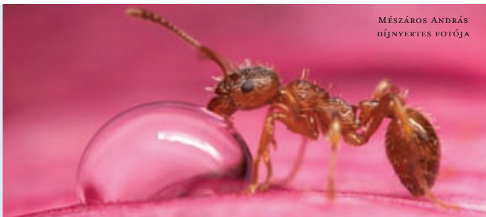
MÉSZÁROS ANDRÁS DÍJNYERTES FOTÓJA

A fotós a képpel a „Viselkedés: egyéb állatok” kategóriában hódította el az első helyet. Ebben a kategóriában azon képek szálltak versenybe, melyeken az emlősökön és ma-